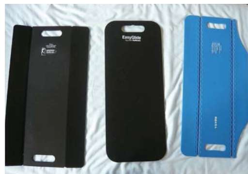
大きさ、形は用途に合わせ様々