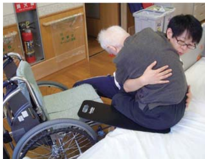
滑らせて移乗します

『介護する方、される方ともに無理のない介護』を目指し、お勧めの道具をご紹介します。紹介しているこのコーナーも3回目となりました。 今回は『トランスファーボード』という移乗支援用具をご紹介します。 これはベッドと車いす間を移乗する際に使う道具です。写真のようにお尻の下にこのボードを敷き、その上を滑らせて移乗します。滑らせることで介助者は相手の身体を持ち上げる必要がないため、大きな負担なく移乗介助を行うことができます。