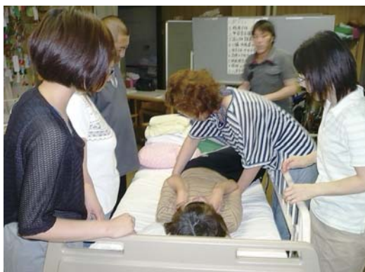
ねじれた姿勢のチェック中

が必要か』というテーマで体験してみました。まず体の歪みを補整し、局所的に圧力がかかっている部分を探します。ここで大事なセンサーとなるのが介護者の『手』。クッションなどを挟んで圧力を分散さ