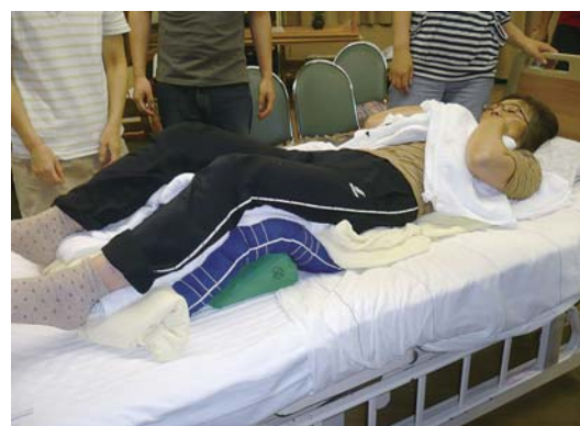
ポジショニング後

せることで褥瘡の予防になります。無理に掴んだりするとそれも筋緊張に繋がってしまうので声を掛けながらゆっくりと行います。拘縮の度合いは人それぞれで写真のようにうまくはいきませんが、拘縮を予防するには早期対策が有効で、そのためには日々利用者の状態を観察し、変化に対応する『気付きの力』が重要となります。本格的な導入には理学療