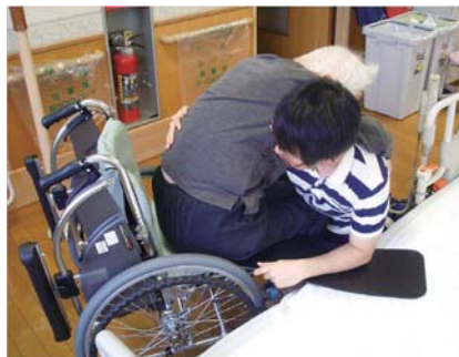
お尻の下にボードを敷きこみ