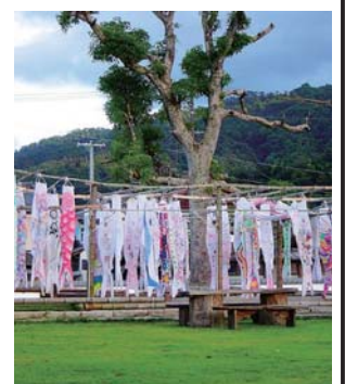
ずらり並んだ力作

当日は150匹あまりの鯉のぼりが大手川の風になびき、圧巻の光景で、どの鯉のぼりも傑作ぞろい。同