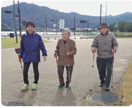
「背筋が伸びて若返り!!!」

当日は、雨上がりの冷たい風が吹いていましたが、ものともせずポールを上手く使い足どりも軽く、普段以上に張り切って歩かれ「いつも、杖で歩いている時は、どうしても姿勢が丸くなって、歩行も不安定やけ