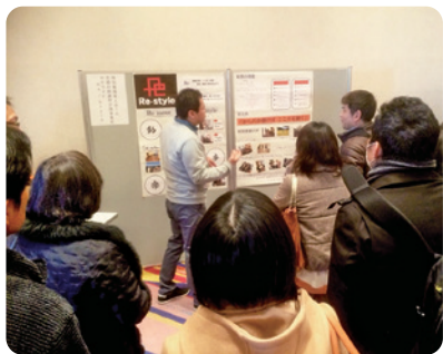
「適度な運動で若返り!!」

初めての試みとあって、試行錯誤の連続でしたが、Re-styleの現状や一番伝えたい事がわかるよう、「Remove from