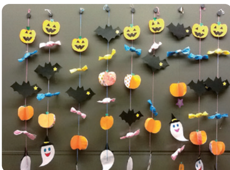
壁一面のかぼちゃの飾りができました

今年度の手作業レクでは【新しい文化に触れてみよう】という事で9月にハロウィンの吊るし飾り作りをしました。説明の時点で「それ、何なん？ お化けか？」の質問が殺到……しかし、可愛いお手本を見ると、たくさん作って下さり、「孫