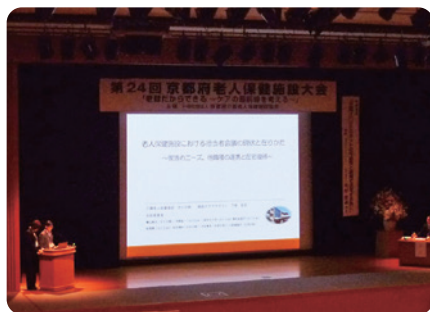
京都テルサ、大ホールにて