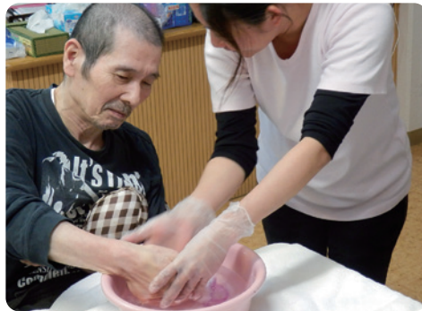
ひとつひとつの動作を確認

年に2回実施する吐物処理の实地研修では、細かい手順を再確認します。実際の緊急時、どれだけ実践できるか？ 事前の備えがきちんと出来ているか？ 普段からマニュアルの要点をしっかりと認識しておくことが必要です。