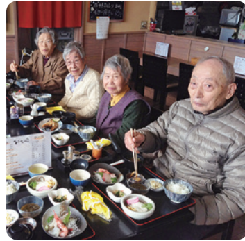
「運動のあとのご飯は格別!」

ど、ポールを持つと、自然と目線が上がって、背筋も伸びて歩けるな」とポールウォーキングの効果をも身をもって体感された様子でした。