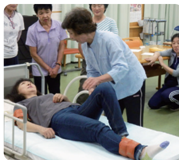
介護技術を学び明日から実践

ている調理実習でした。近くの公民館の調理場をお借りし、利用者のお宅にありがちな身近な野菜を使って、短時間で簡単に調理できる、おいしく食べやすい料理を作りました。主婦歴の長いヘルパーも多く、次々に料理が出来上がりました。