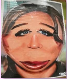
本人より美人？ 「えふ笑い」