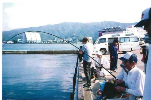
27日。この引きは！大きな魚か？それとも地球かな？

今年も天候もバッチリ！釣りに対する情熱もバッチリ！行ききのバスの中では「何が釣れるんやろ〜」「大物が釣れたらいいなあ」「釣れんかったらどうしよ〜」と話し声が聞こえてきました。中には、自分の竿や道具を持って来る方や、生まれて初めて魚釣りをする方もいま