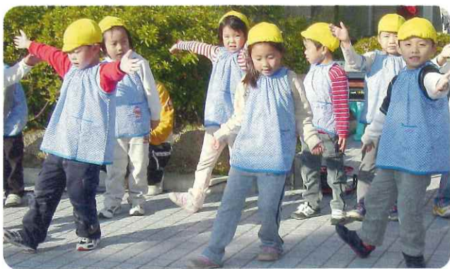
笑顔で元気一杯に踊る園児たち (天橋園中庭で)