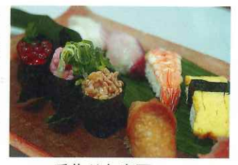
手作りお寿司。美味しうでしょ？

職員が「何にしましよ うか？」と尋ねると、「ハ マチがええ」「お稲荷さ んおくれーな」とみなさ んそれぞれに好みのネタ