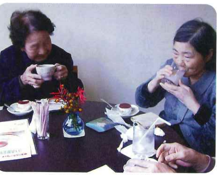
限定メニューに舌鼓。

「よくミルキーウェイに は来られるんですか？」 と尋ねると「よく来ます」 と答えてくださいました。 そこへ同じユニットの 方も来られて限定メニュ ーをご注文。あつという 間に残りは1つ。「最後の 1つになったわ」との声 に「私はコーヒーだけ」 と注文されていた中なさ んも「じゃ私も」と。「今日 はきれいになくなつたな あ」とボランティアさん も笑顔でした。