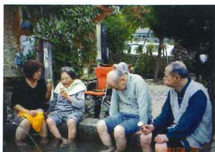
山口さんは「気持ち良くて」思わずコックリコックリ...