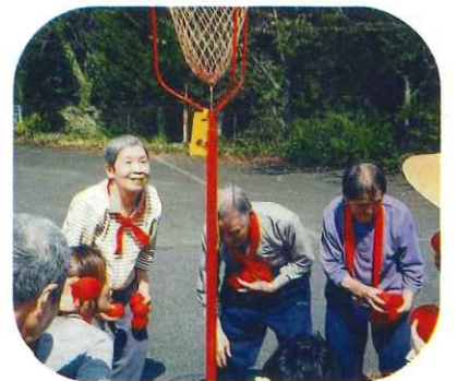
いくつもてるかな?