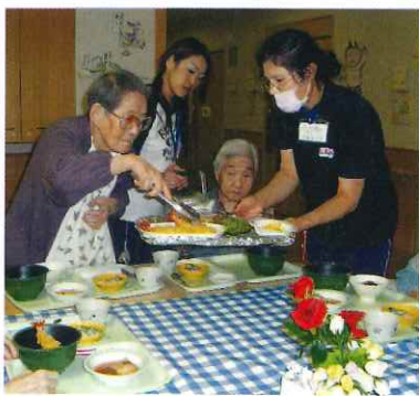
好きな具を選んでうどんの中へ

普段盛り付けてこられる具を「目の前で選ぶ」というだけで、いつもと違う食事になりました。次回は何が選べるのかな？ (平田憲雄)