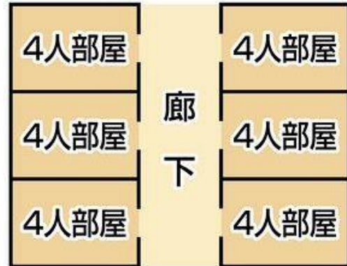
多床室のイメージ