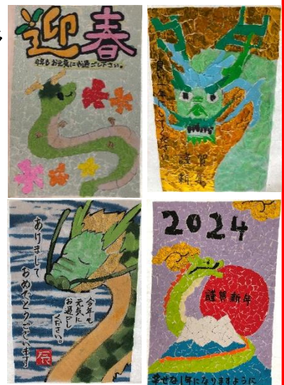
栗田中学校の生徒さんからいただきました。

今年も、天橋の郷が福祉の分野のみならず、災害発生時など様々な場面において地域の皆さまの安心と安全の要となるよう取り組んでまいりますので、変わらぬご支援を賜りますようよろしくお願い申し上げます。