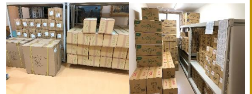
【食料・飲料水などの備蓄物資】