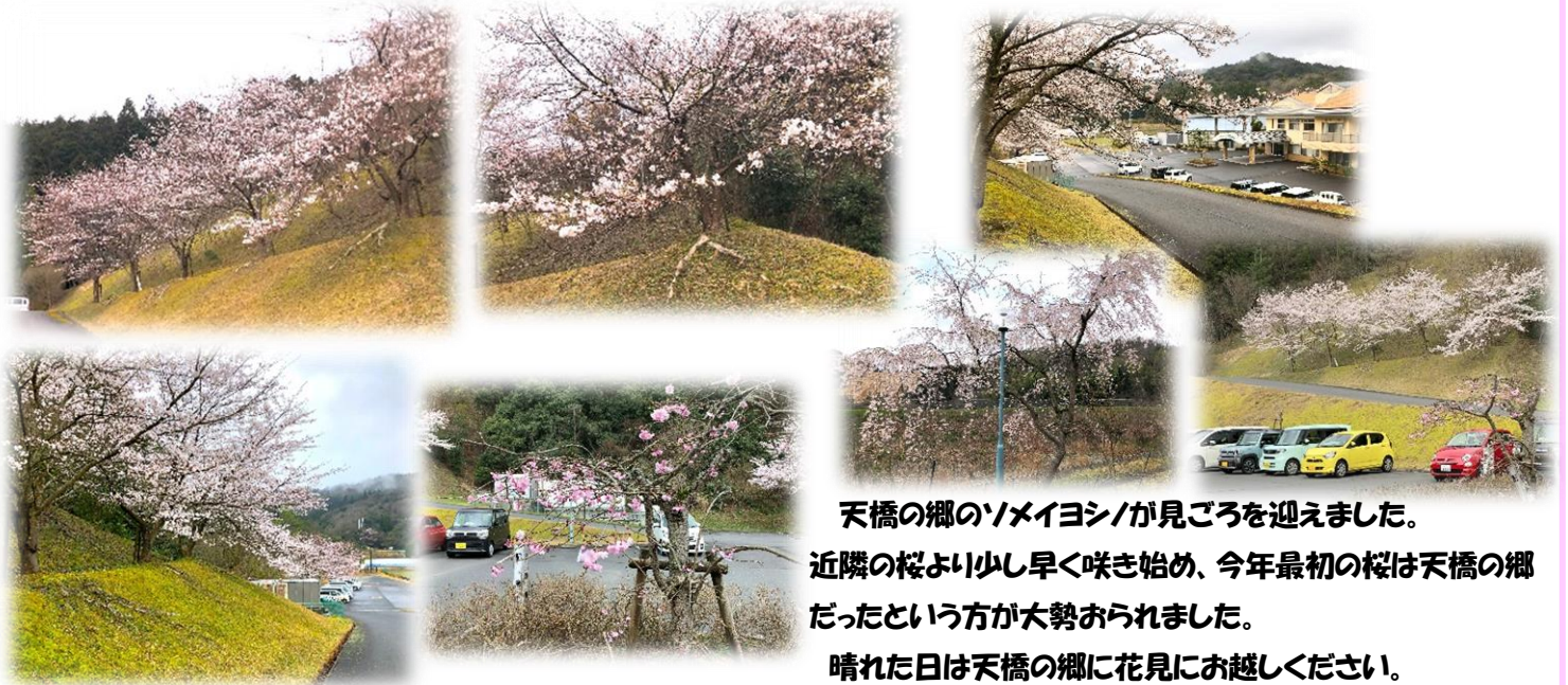
天橋の郷のソメイヨシノが見ごろを迎えました。近隣の桜より少し早く咲き始め、今年最初の桜は天橋の郷だったという方が大勢おられました。晴れた日は天橋の郷に花見にお越しください。