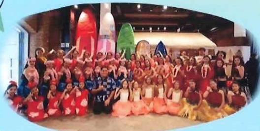
舞台発表フラダンス (Halau Hula Akahai Malie)