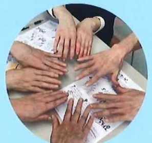
ハンドマッサージ体験