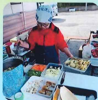
災害支援ユニオン∞クリキンディーズ (炊出し体験食堂)