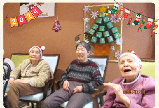
クリスマス会も大盛況!