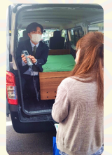
福祉用具勉強会の様子