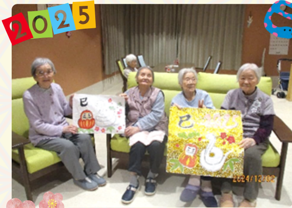
（お金持ちになれるかなあ(笑)）

日ごとに寒さが厳しくなってきましたが、天橋の家では、寒さにも負けない皆さんのお元気な姿が見られます。昨年の12月に天橋の家でクリスマス会を行いました。職員が準備したプレゼントに、利用者からも自然と笑顔があふれていました。